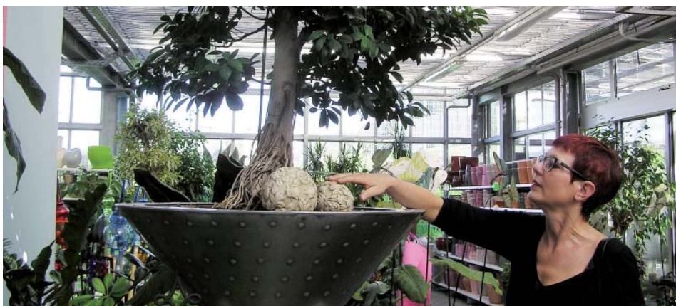
Veškeré zboží je vkusně barevně sladěno, prodejní plocha je velká a prosvětlená.