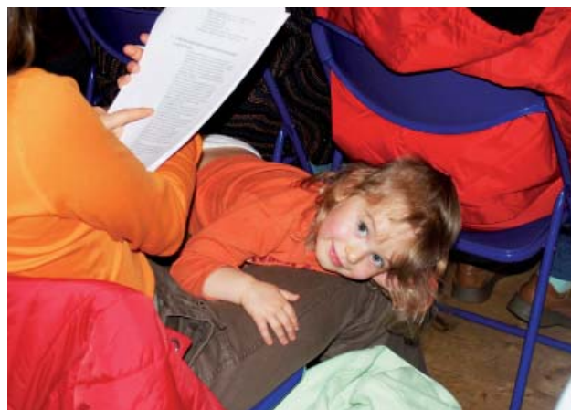
Některé ženy si vzaly na kurz i děti.