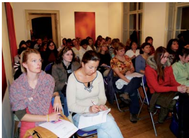
Kurz v českobudějovické Galerii Měsíc ve dne byl zaplněn do posledního místa.

profesi se v budoucnu věnovat nechci. Jsem ve fázi hledání nových možností.